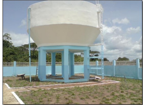
Abastecimento água em Cabinda e Soyo