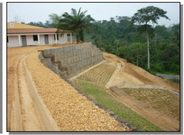
Hospital Municipal & Alz. Fonseca – Buco Zau Cabinda