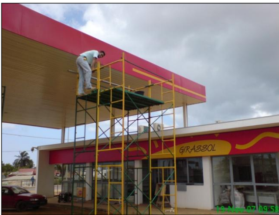
Postos de Abastecimento da Sonangol