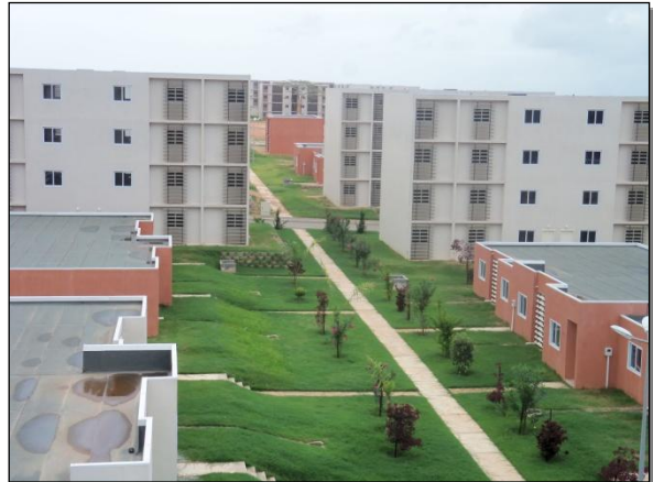
Empreendimento Horizonte Kora – Sumbe