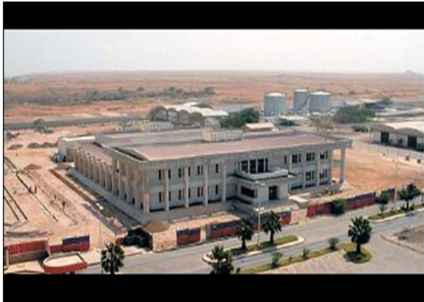
Edifício control de trafego aéreo – Sal Cabo Verde