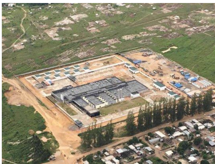
Patra Hospital – Pointe Noire