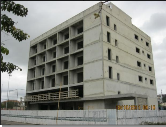
Hotel Paraiso – Cabinda